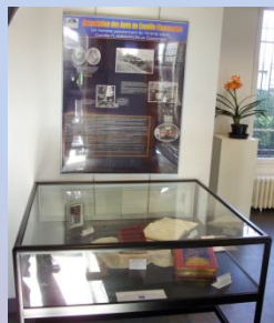
Exposition à Savigny-sur-Orge Pendant un mois