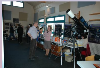
Animation à Breuillet