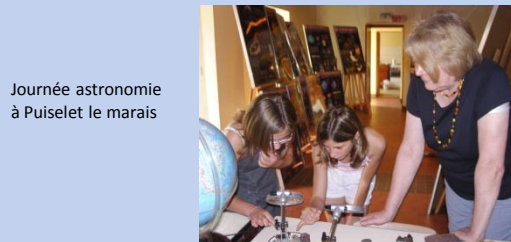
Journée astronomie à Puisielet le marais