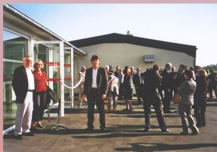
Visite des amis à Montigny le Roi

Elle propose tous les mois des conférences gratuites