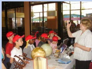
Centre de loisir de Juvisy-sur-Orge

L'association intervient dans les écoles, les communes, et dans le parc de l'observatoire.